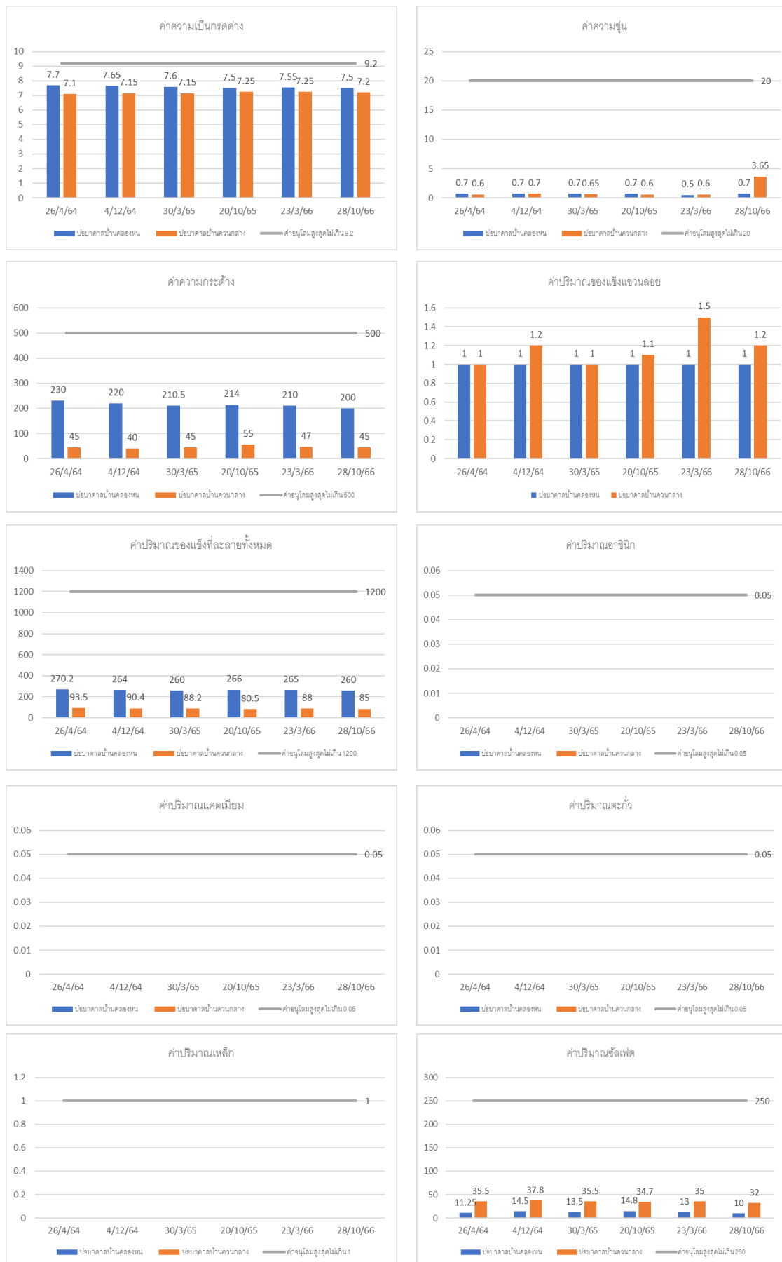
รูปที่ 3-4 กราฟแสดงการตรวจวัดคุณภาพน้ำใต้ดินปี พ.ศ.2564-2566