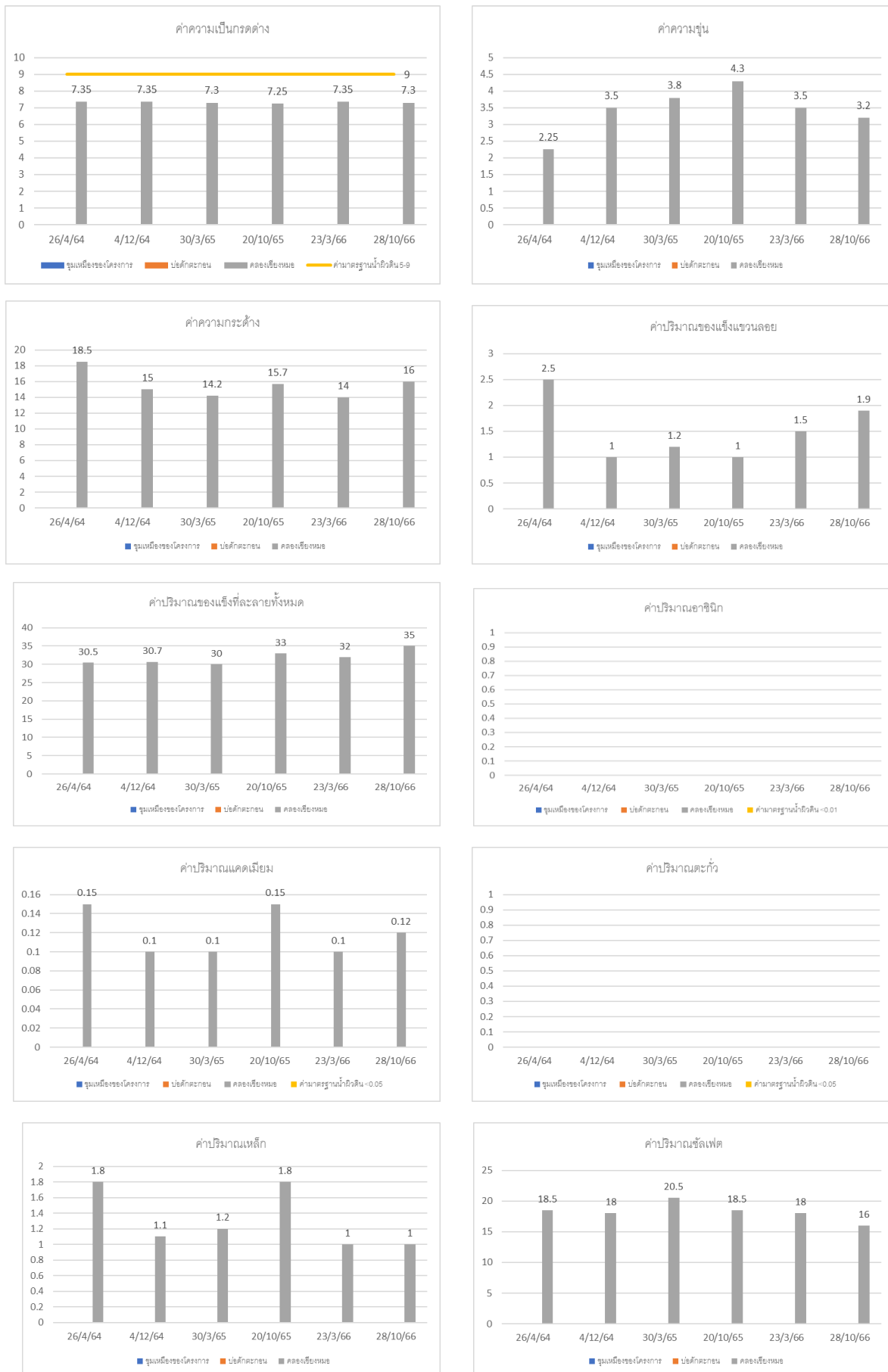
รูปที่ 3-3 กราฟแสดงการตรวจวัดคุณภาพน้ำผิวดินปี พ.ศ.2564-2566